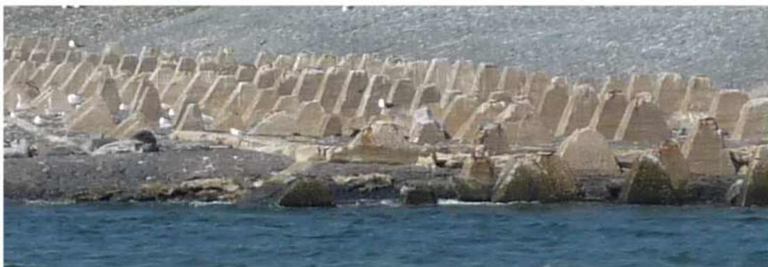
Dents de dragons

A Ijmuiden , les batteries côtières, poste d'observation, casemates, abris troupes sont toujours là, libres d'accès; pour la joie des spécialistes de la forteresse, il y a de tout des R671, R635, R644, M178, M272, ainsi que des dents de dragons R631 sur la plage. Quant à l'abri pour sous-marins, il est englobé actuellement dans le dépôt d'une usine chimique et donc non visitable. Cet édifice est aussi gros que celui de la Rochelle en France et particularité, les sous-marins y accédaient par-dessous et non par de flanc comme à la Rochelle.