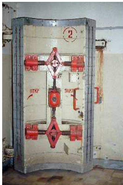
Porte de sécurité

Les Soviétiques quittent Zossen en 1992 et vident totalement l'intérieur des salles de commandement. Les maisons d'habitation qui entouraient ces lieux et avaient entre temps reçu les hôtes soviétiques et leurs familles ont été transformées depuis en logements pour civils; ces bâtisses au milieu de la forêt ont retrouvé la vie joyeuse du temps des préparatifs olympiques; les souterrains de Maybach I et II sont à présent visitables avec guides, pour un parcours de plus 2 heures. Si vous êtes dans la région n'hésitez pas, ça vaut le détour et il y a encore tant de choses à découvrir en surface dans cette région.