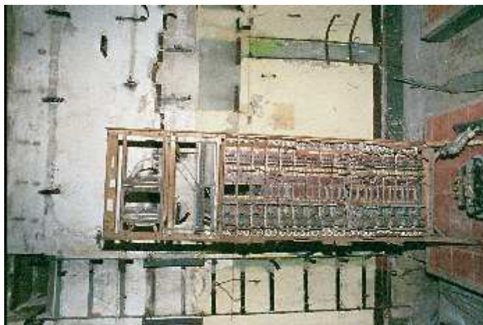
Ce qui reste des installations de transmission

Le 20 avril 1945 à Zossen, on continue d'émettre alors que les troupes soviétiques ont déjà traversé la ville en direction de Berlin; mais cette fois-ci dans l'autre sens, on transmet les mouvements des troupes soviétiques à ce qui reste du commandement allemand à Berlin par l'entremise des machines à décrypter installées dans la tour DCA implantée dans le jardin zoologique et à l'OKW situé à Rheinsberg, au nord de Berlin.