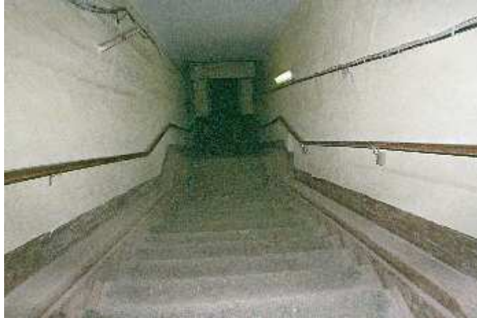
Descente au souterrain