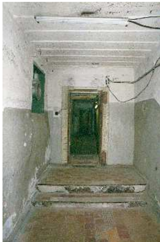
Départ des lignes enterrées

Une fois la guerre terminée, les soviétiques font main basse sur cet endroit qui renferme toute la technologie avant gardiste allemande, produite par Siemens, Telefunken, Schaub Lorenz et qui a trois générations d'avance sur ce qui se fait à l'époque. Les maisons en bétons sont dynamitées et les souterrains et salles de travail deviennent un des postes de commandement de télécommunication du Pacte de Varsovie.