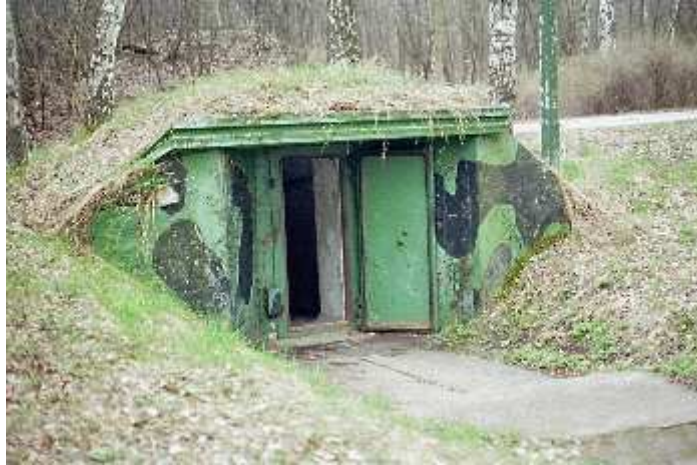
Sortie de secours

Les Soviétiques quittent Zossen en 1992 et vident totalement l'intérieur des salles de commandement. Les maisons d'habitation qui entouraient ces lieux et avaient entre temps reçu les hôtes soviétiques et leurs familles ont été transformées depuis en logements pour civils; ces bâtisses au milieu de la forêt ont retrouvé la vie joyeuse du temps des préparatifs olympiques; les souterrains de Maybach I et II sont à présent visitables avec guides, pour un parcours de plus 2 heures. Si vous êtes dans la région n'hésitez pas, ça vaut le détour et il y a encore tant de choses à découvrir en surface dans cette région.