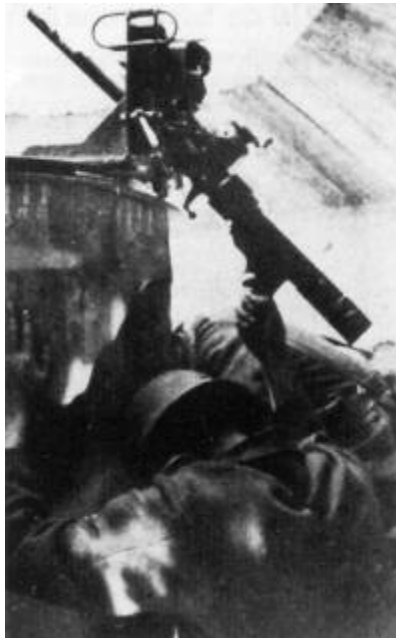
Image faite sur le Mur de l'Atlantique où l'on peut voir l'utilisation d'un mortier de 50 de la LIGE MAGINOT par l'armée allemande dans un encuvement de type TOBROUK adapté à cette arme de prise.