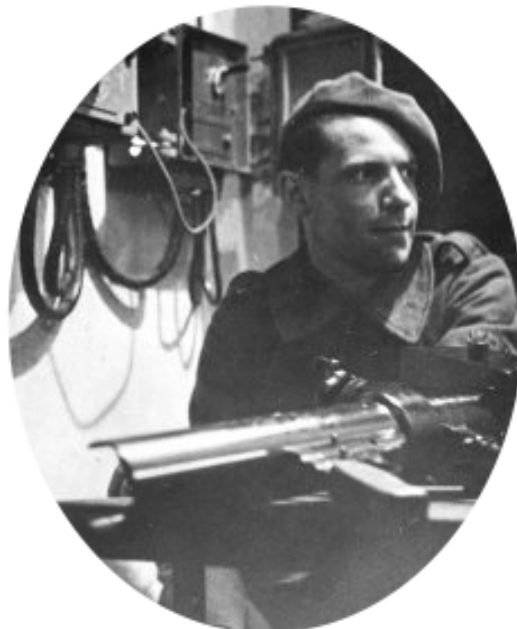
Mortier de 50 (archives militaires BRUXELLES).

Tourner dans le sens « plus loin » pour amener la division du disque en face de son repère.