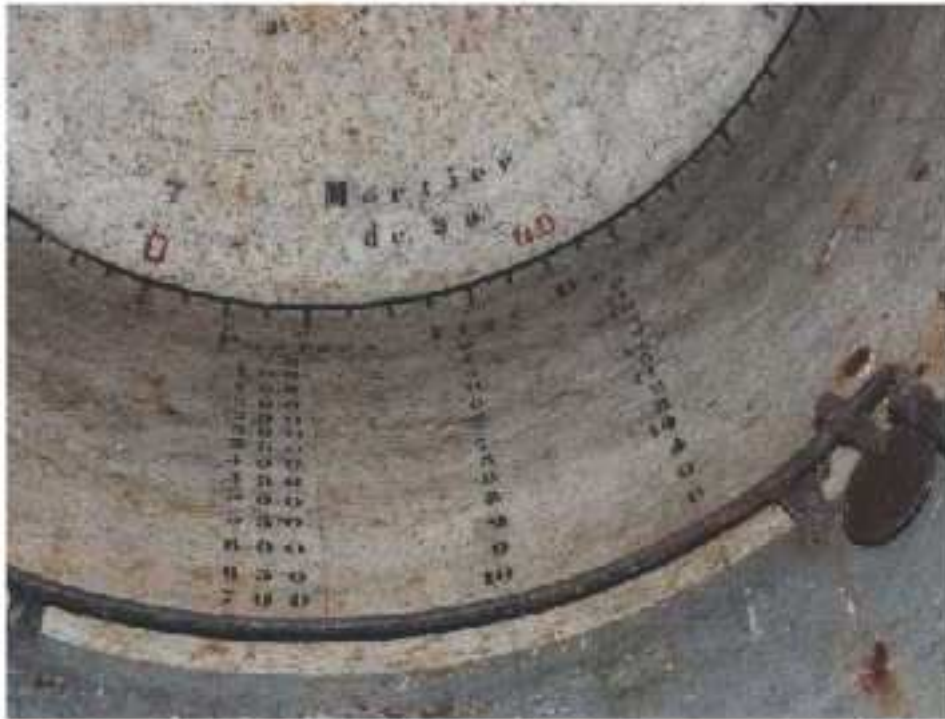
Tableau de tir pour mortier de 50 peint sur l'intérieur d'une des deux cloches type « A » à 3 créneaux de la Casemate de MORFONTAINE (noter aussi la tringle circulaire).