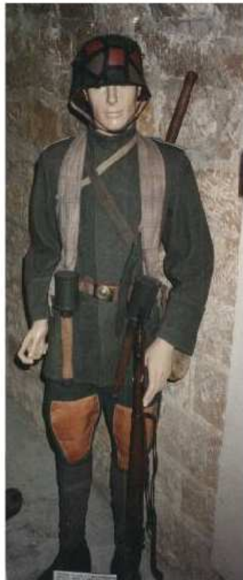
Musée du Fort de la POMPELLE (1990) Soldat allemand

Violent bombardement qui redouble le 28. Nous avons plusieurs hommes intoxiqués par le gaz. Le 7 ème régiment de Fusiliers de la 3 ème division de la Garde est devant nous. Nous lui faisons 2 prisonniers dans ARRACOURT.