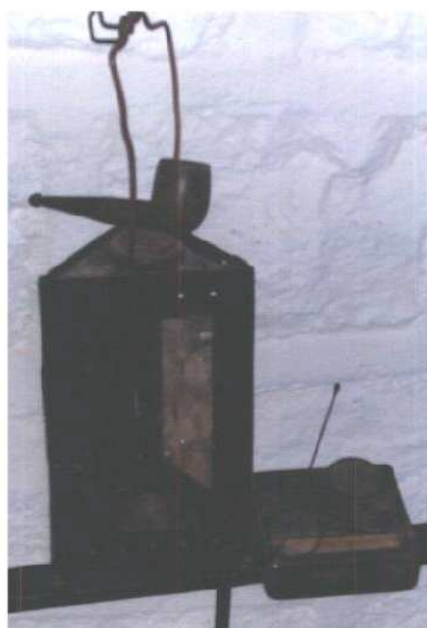
Reconstitution au Fort de Condé sur Aisne (2006) Objets courants des tranchées(lanterne, pipe...)