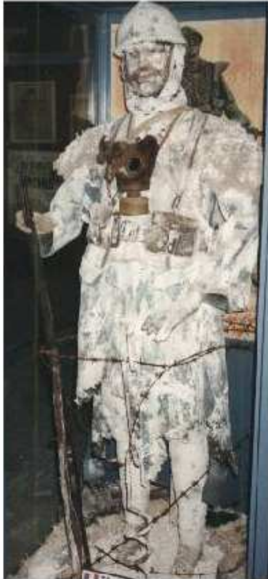
Musée du Fort de la POMPELLE (1990) Soldat français