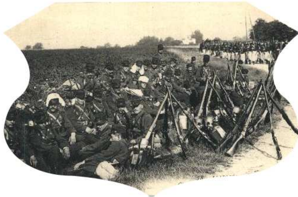
Chasseurs à pied faisant une halte sur une route.