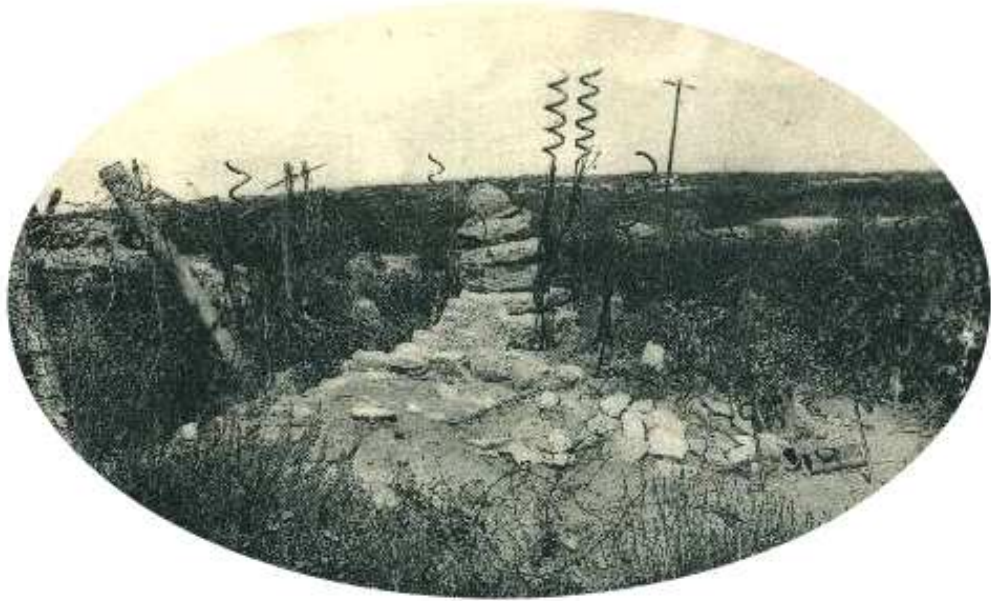
Monument d'HURTEBISE dans les années 20