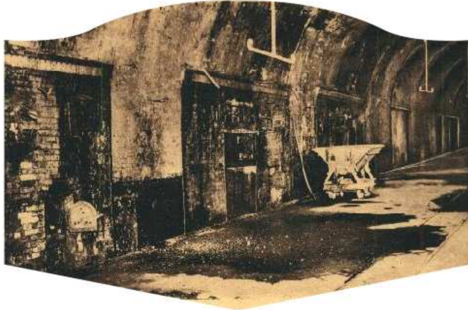
Citadelle de VERDUN, fours à pains

Départ en convoi de BUSSY LE CHATEAU, arrivée le lendemain à NIXERVILLE près de VERDUN ; le Bataillon se rend à la citadelle.