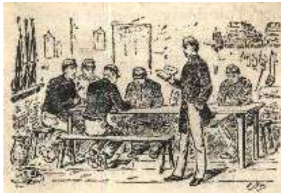
La vie dans la chambrée

En dehors des inévitables corvées, je pense qu'il n'est pas trop difficile d'imaginer les conversations, échanges et tout ce que comporte la vie en communauté lors des temps libres dans la chambrée.