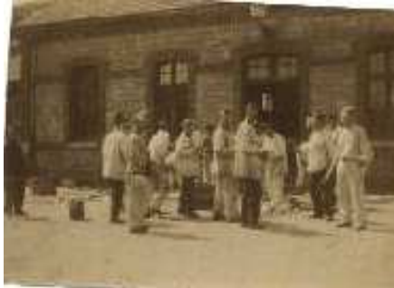
Corvée de peluche de légumes

Il sont pris dans la chambrée. Le soldat mange tous les jours sa soupe dans sa petite gamelle en fer-blanc.