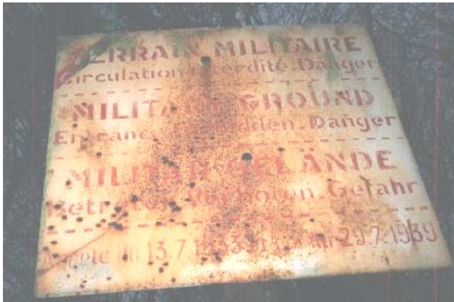
ECOUVIEZ OUEST (Avril 1992)