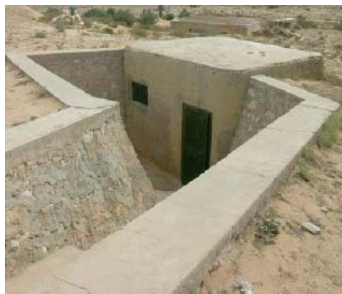
Le blockhaus transmissions

Ces constructions se démarquent par l'absence totale de cuirassements. Dans l'un des blockhaus antichars, on note la présence d'un tube quasi-vertical dans l'un des murs de flanc. Cette installation fait vaguement penser à une goulotte lance-grenades. Seul le blockhaus transmissions possède une ouverture sommitale, dont l'utilisation ne nous a pas été expliquée. La présence de petits créneaux rappelant les créneaux de fusillade est amusante. La ventilation et l'éclairage (même à lanterne) ne semblent pas avoir été prévus lors de la construction.