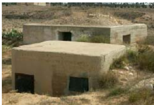
Blockhaus de commandement et blockhaus antichars