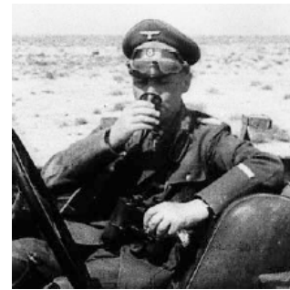
Rommel lors de sa campagne africaine

Suite à leur défaite face à la Ville armée britannique du Général Montgomery le 4 octobre 1942 à El-Alamein (Egypte), les forces germano-italiennes de Rommel entament un repli désordonné vers la Tunisie. Le haut commandement des forces de l'Axe ordonne alors de réarmer et de renforcer la Ligne Mareth afin de permettre à Rommel de retarder les Britanniques. Cette remise en état s'est effectuée de novembre 42 à mars 43. La mobilisation nécessaire de 7000 soldats et civils a permis de réaliser 25 km de fossés antichars, d'aménager les lits et les berges de l'oued Zigzaou et de ses affluents, de poser 100 km de barbelés, 100 000 mines antichars et 70 000 mines antipersonnel ont aussi été posées. Après ce réarmement et ces modifications la Ligne Mareth est devenue difficile à franchir, particulièrement en période de crue de l'oued.