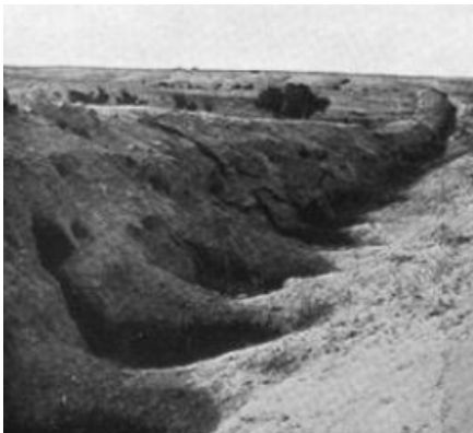
Obstacle antichars sur la Ligne Mareth

La bataille de Mareth a eu lieu au mois de mars 1943. Elle a coïncidée avec la pression alors au centre et au nord de la Tunisie par les forces alliées, commandées par le général Anderson, sur les forces de l'Axe commandé par le général Von Arnim (2). Au même moment, les alliés commencent à retrouver la suprématie aérienne et maritime dans le bassin méditerranéen. 160 000 alliés affrontèrent 76 000 hommes de l'Axe.