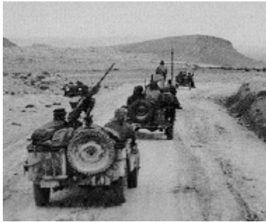
Patrouille dans le désert

antiaériens. En plus des casemates, des fossés antichars ont été creusés, des barbelés installés et des champs de mines réalisés. Au lendemain de la défaite française de 1940, une commission germano-italienne a procédé à la démilitarisation de cette ligne défensive.