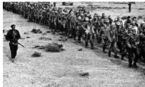
Départ en captivité de troupes de l'Afrikakorps

La bataille de Mareth a commencé le 16 mars 1943, lorsque les forces de Montgomery attaquent sur deux axes différents : d'une part sur la ligne fortifiée elle-même entre Mareth et la côte, d'autre part en tenant une opération de