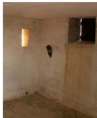
Intérieur d'un blockhaus mitrailleuses

L'observation des alentours permet de bien réaliser l'importance de l'oued dans la conception de cette ligne. Il s'agit en effet d'un obstacle antichars et antipersonnel d'importance.