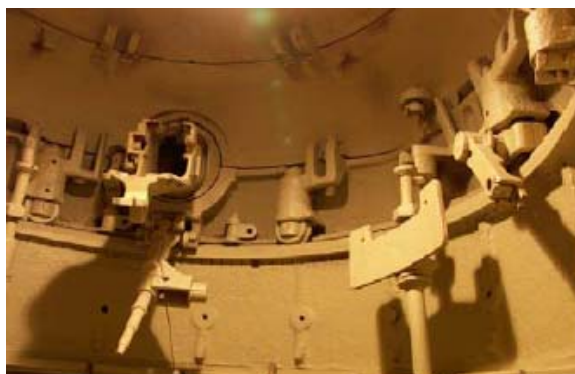
Tourelle démontable vue extérieure et intérieure

En effet, cette tourelle est identique à celles équipant, à l'époque, nos contrées... à un détail près : l'absence totale de marquage de fonderie (désolé pour les mordus de TD).