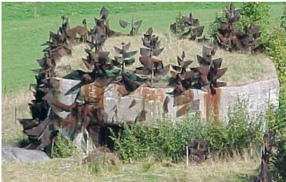
Camouflage d'un fortin par de faux sapins

mise en chantier d'un ouvrage militaire a été décidé en 1937 sur le flanc sud de la ville frontière de Vallorbe.